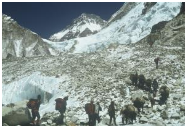
7 - Od Namče Bazarja dalje nižinske nosače zamenjajo višinski nosači. Roba se prestavi tudi na njihove tovrne živali, jake, ki so prilagojeni mrazu in visoki nadmorski višini.