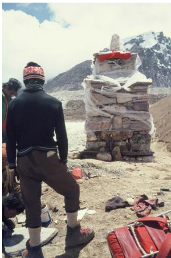
43 - Vse kar so na koncu člani odprave lahko storili za Ang Phuja je bil kamniti čorten na ledeniški moreni, na Gorak Shepu.