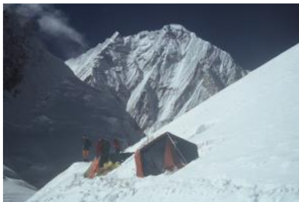
13 - Tabor 1 na višini 6050 m, preden so zaradi močnih vetrov bivalne prostore izkopal v sneg. Zadaj je lep viden sedemtisočak, Nuptse, 7861 m.