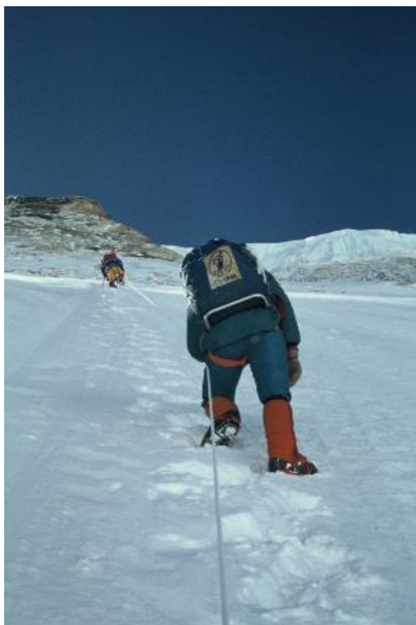
16 - Plezanje v steni Zahodne rame.