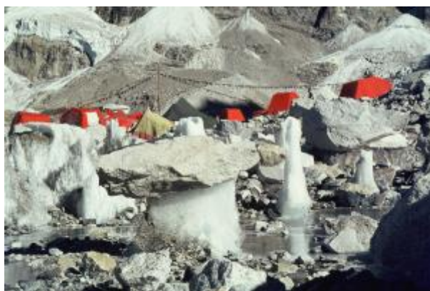
8 - Bazni tabor na ledeniku Khumbu, je stal na debelih skladih ledu, na nadmorski višini 5350 m. Postavljenih je bilo 20 bivalnih šotorov, ter šest velikih šotorov za kuhinji, jedilnico in skladišča. Domovanje za dva meseca. »Baza je pust in vetroven kraj, daleč od zadnje travice, zato naj nudi čim več udobja. Nad njo se dviga najvišja gora sveta, ki zahteva cele ljudi in dolgo obleganje...« Tone Škarja