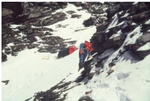
25 - Tabor 5 na višini 8120 m, poimenovan Energoinvest.

Zadnji tabor pod vrhom je bilo treba postaviti čim višje, da bi se naveza v enem dnevu lahko povzpela na vrh in varno sestopila nazaj. Do sem so bile napete vrvi, od tukaj dalje je navzgor vodilo le golo plezanje in volja....ter veliko sreče.