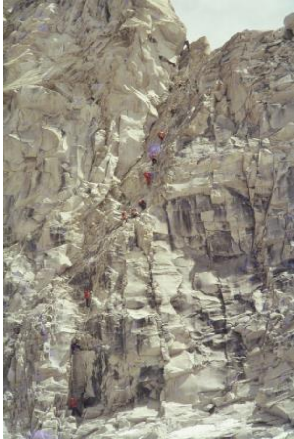
9 - Stena sedla Lho La je bila visoka 700 metrov. Šerpe na visečih lestvah v steni.