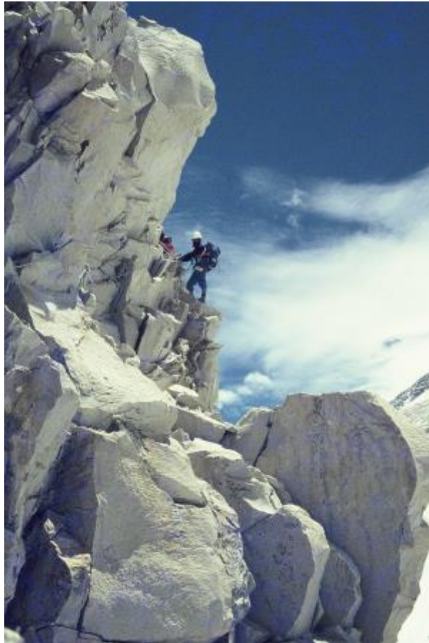
10 - Fiksne vrvi v steni sedla Lho La.