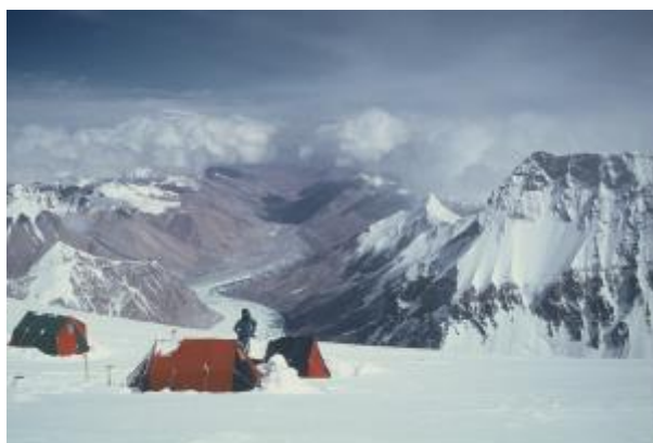
23 - Tabor 4 na nadmorski višini 7520 m se je imenoval Krka. Prostorno mesto je imelo čudovit razgled na ledenik Rongbuk v Tibetu.