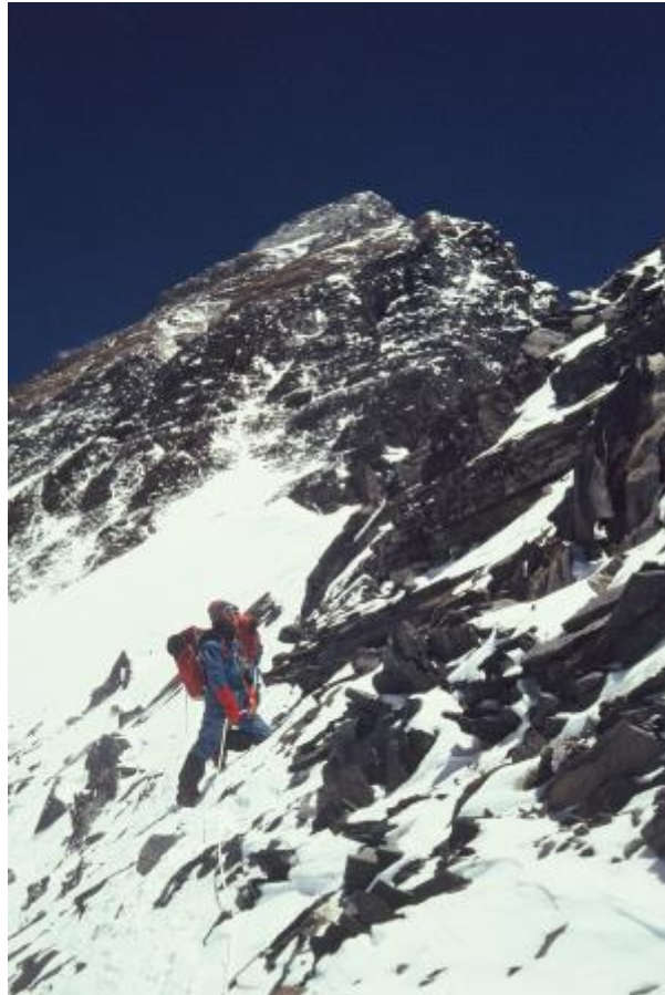
19 - Tik pod vrhom Zahodne rame.