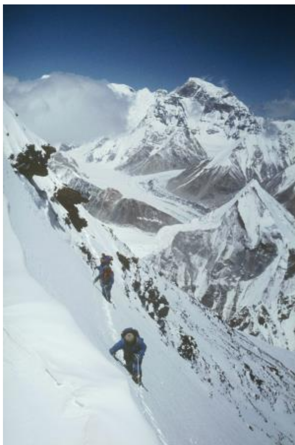
22 - Plezanje proti taboru 4.

V ozadju vršna piramida Everesta, z višinsko razliko 1350 m. Za običajnega človeka bolj del veselja, kot pa Zemlje, za človeško telo pa cona smrti.