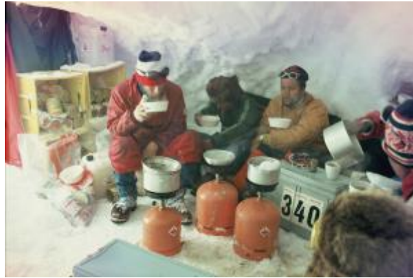
14 - Tabor 1 na višini 6050 m se je imenoval Alpina. Ker je bilo sedlo podvrženo stalnim vetrovom, je bil tabor izkopan v sneg in led. Urejene so bile spalnice, kuhinja in skladišče.