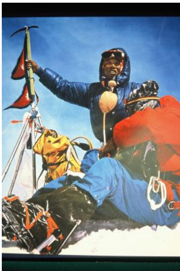
38 - Nepalska zastava v rokah šerpe Ang Phuja. V tistem trenutku je bil drugič na vrhu Everesta in prvi človek, ki ga je dosegel po dveh različnih smereh.