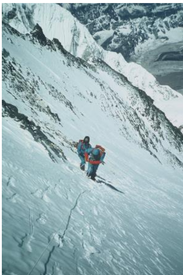
24 - Plezanje proti taboru 5.