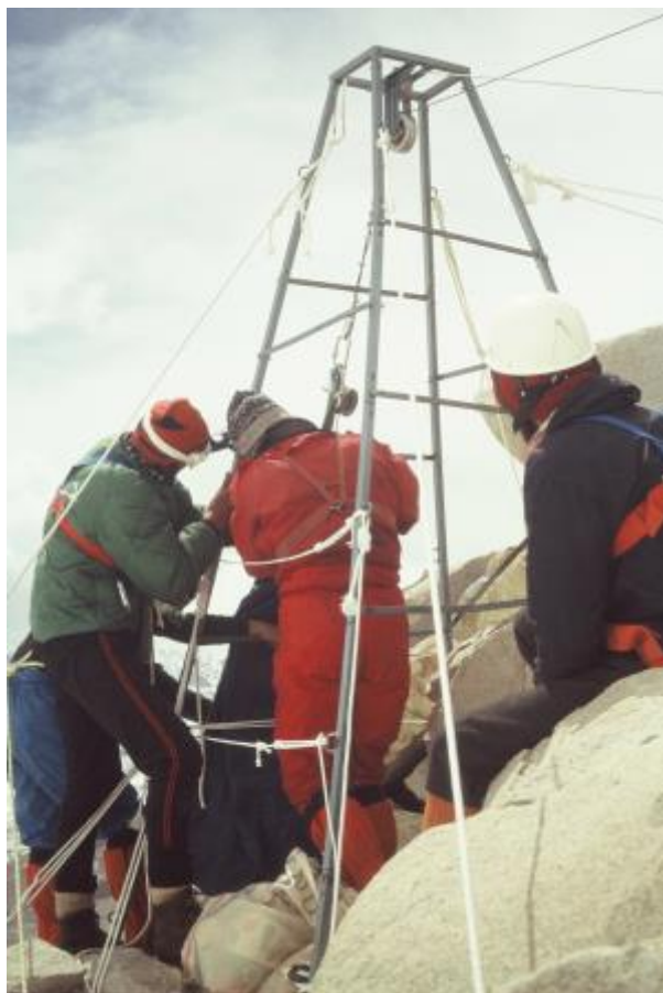
12 - Preko najtežjega dela stene sedla Lho La, njenega vršnega dela, so si zaradi previsnosti pomagali z ročno žičnico. Skonstruiral jo je Štefan Marenče. Na sedlo so dnevno prepeljali med 300 in 400 kg, skupno 6 ton opreme. Skupaj so opravili preko 500 vzponov čez steno.