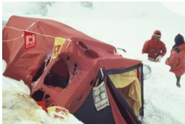
20 - Tabor 3 se je imenoval Rašica. Stal je na višini 7170 m, tik pod vrhom Zahodne rame. V enem od dveh šotorov se je šerpam pri menjavi plinske bombice vnel šotor, ki je zagorel. Žal ni bil več uporaben.