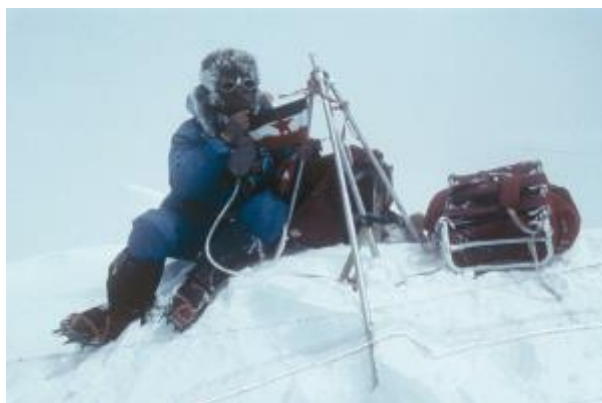
33 - Andrej Štremfelj na vrhu Everesta, 13. maj 1979.

»Korak za korakom sva se 13.5.1979 bližala točki, s katere vse poti vodijo samo še navzdol –v življenje!« Andrej Štremfelj