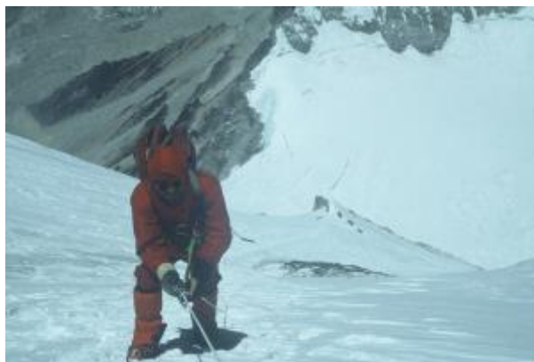
17 - Plezanje v steni Zahodne rame.