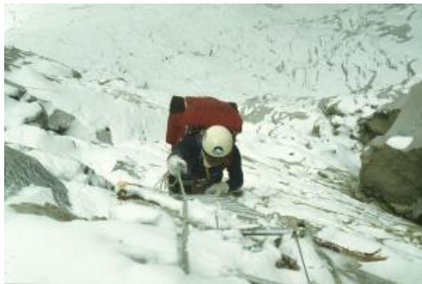
11 - Stena je bila marsikdaj zjutraj povsem snežena. Na najtežja mesta stene so namestili aluminijaste lestve, čez najstrmejši del pa celo jamarske lestve in neraztegljive vrvi.