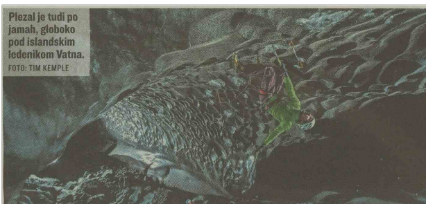
Plezal je tudi po jamah, globoko pod islandskim ledenikom Vatna.