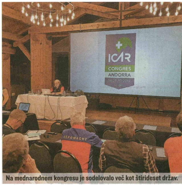
Na mednarodnem kongresu je sodelovalo več kot štirideset držav.