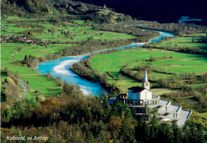
Kobarid, sv. Anton