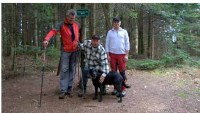
Ogledna tura na Žavcarjev vrh.