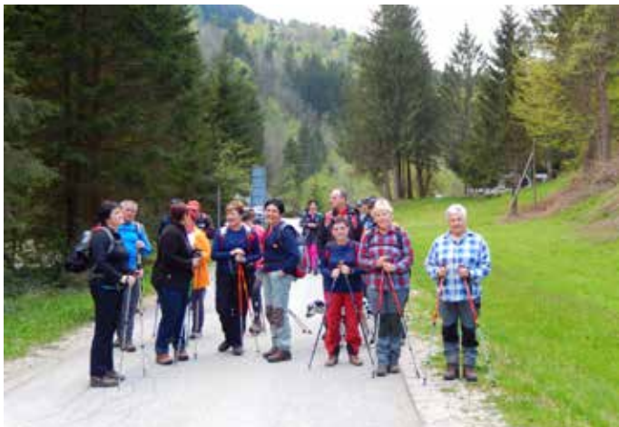
Zbor pri karavli in odhod proti Sv. Jerneju.

Vabimo vas, da poskusite vsaj enkrat, kako je hoditi s svetilko na čelu.