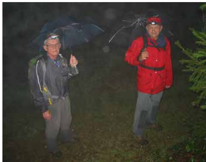
Pohod ob vsakem vremenu.