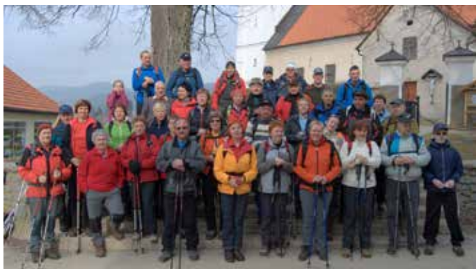
Remšnik ena izmed točk Kozjaške planinske poti.