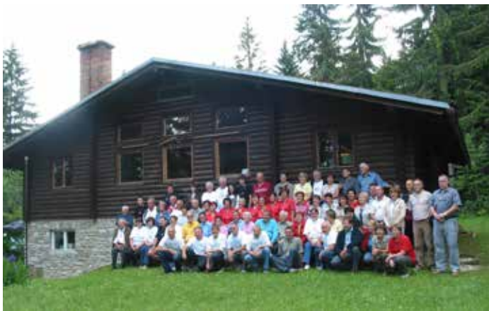
Abrahamovanje na Pernicah 3.6.2007