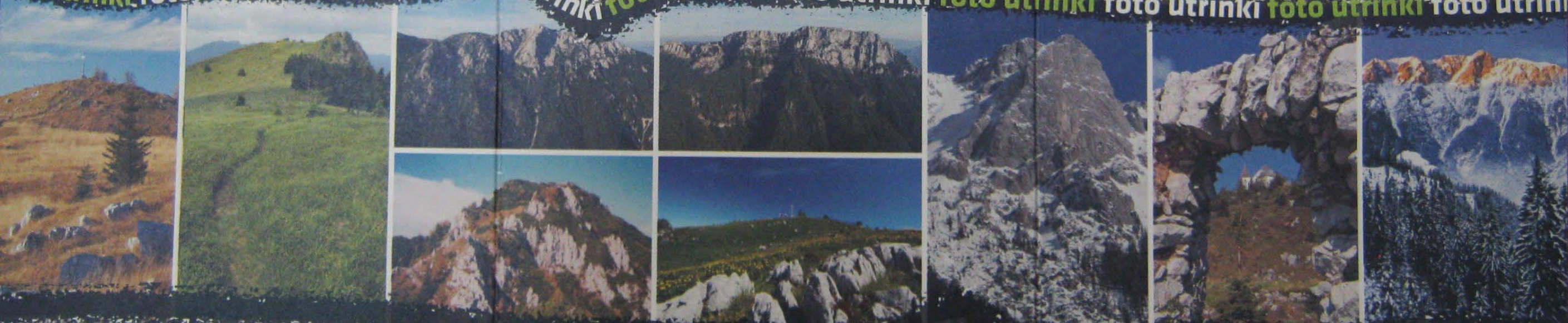
foto utrinki foto utrinki foto utrinki foto utrinki foto utrinki foto utrinki foto utrinki foto utrinki foto utrinki

Če ste v to prepričani, vas vabimo, da se preizkusite in tako postanete član kluba najbolj vzdržljivih gornikov.