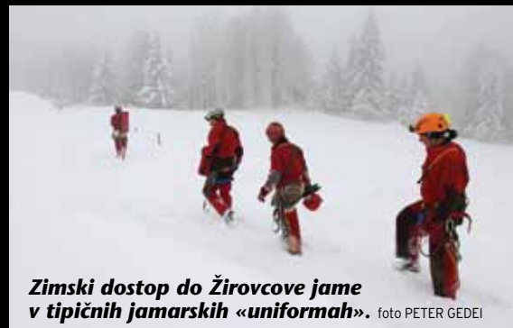
Zimski dostop do Žirovcove jame v tipičnih jamarških «uniformah».

premetavali. Ali se res slišijo glasovi ali je to samo nekakšna fatamorgana? Nenavadnim zvokom se je kmalu pridružilo še bobnenje, kot da se zgoraj sesuva svet. Udarci Milanove ekipe, ki čisti teren na površju!