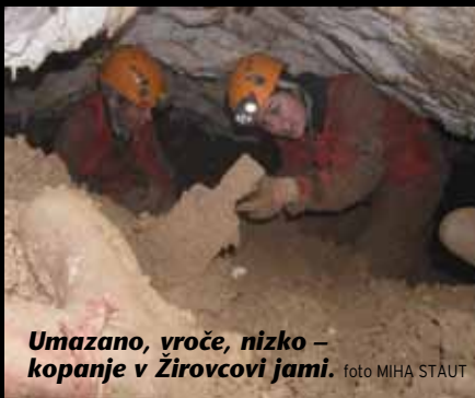
Umazano, vroče, nizko – kopanje v Žirovcovi jami.