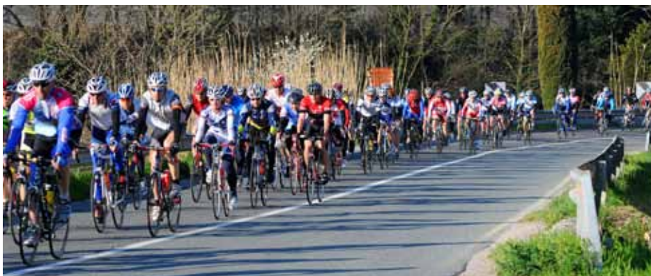
Velika udeležba kolesarjev na brevetu 2011