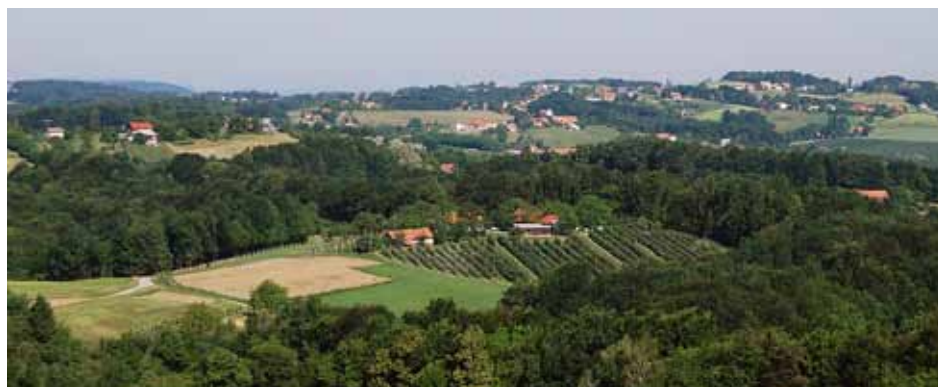
Odprtje Slovenjegoriške poti