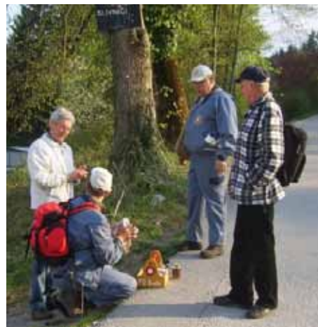
Skupna akcija sanacije poti na Slivnico

Zadovoljni z opravljenim delom smo se ob 15. uri razšli že z mislimi na naslednje področje, kjer bi lahko izvedli novo skupno urejanje planinske poti.