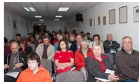
Zbrani na Občnem zboru PD Črnomelj

Na koncu pa smo si ogledali še projekcijo fotografij iz lanskoletnih izletov in poklepotali na družabnem srečanju.