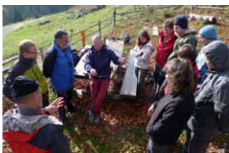
Pod vrhom Kranjske rebri, ali Vrha Kašne planine ali nekdanj Kačjega vrha smo se seznanili z novimi planinskimi vozli