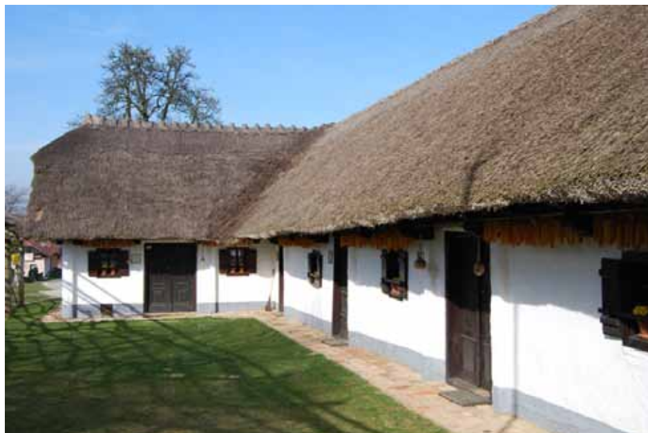
Puhov muzej v Sakušaku