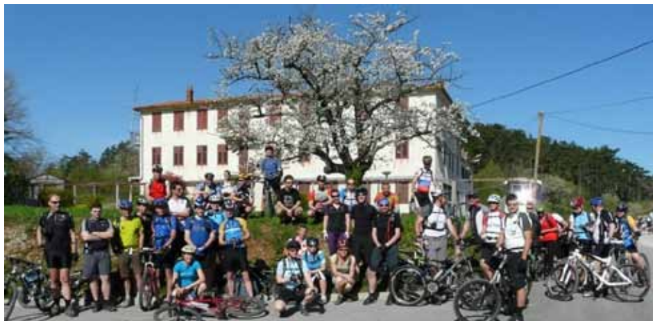
Vsi zadovoljni

Povabilo KTK na Kramp turco in na 3. turnokolesarski tabor: na strani 38.