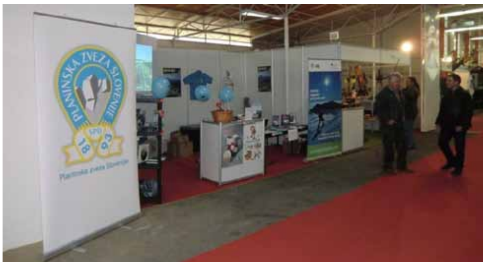
Razstavni prostor PZS na sejmju LOV - Zagledani v naravo!

Planinska zveza Slovenije se je na sejmju predstavila s svojo pestro dejavnostjo od alpinizma, športnega plezanja, vodništva, planinskih poti, turnega kolesarjenja ... s poudarkom na mladih ter varovanju okolja, svetovala je o varnejšem gibanju v gorah, po sejmskih cenah je bil možen nakup edicij Planinske založbe; obiskovalce pa je strokovni sodelavec PZS Matjaž Šerkezi seznanil tudi z novim tematskim produktom, poimenovanim Top Hiking Alps in spletno aplikacijo GAEA+, ki bazira na ortofoto podlagi s celotnim katastrom planinskih poti, planinskimi kočami, heliodromi, plezališči itd.