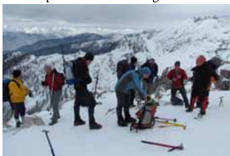
Na vrhu Viševnika je sledil pregled zimske opreme za nadaljevanje vzpona na Mali Draški vrh

In že smo polni načrtov, naših obveznosti po društvih, usposabljanjih, oglednih turah in vodenjih, saj je prišla sezona, ko lahko začnemo z našim znanjem, pridobljenim lani v Bavšici, samostojno voditi po lahkih kopnih poteh. Vseeno pa smo se odločili, da bomo v mesecu juniju našli čas, ko se bomo ponovno srečali in takrat nas bodo naši inštruktorji popeljali po brezpotjih nad Logarsko dolino in nam tako pomagali odkriti še enega od čarov vzponov v naše visoke gore.