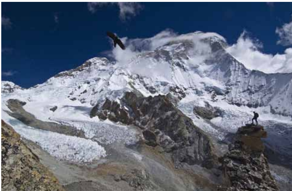
Makalu s svojo zahodno steno