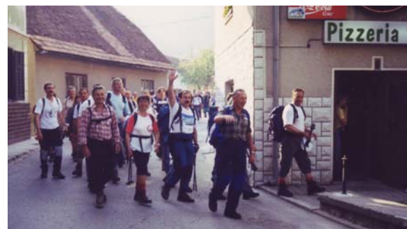
Pohodniki na cilju...

TROJANE—LIPOVEC—ŠPILJK—RAKITOVEC—LAZE—ZG.TUHINJ—RAVNE—GORNJI GRAD