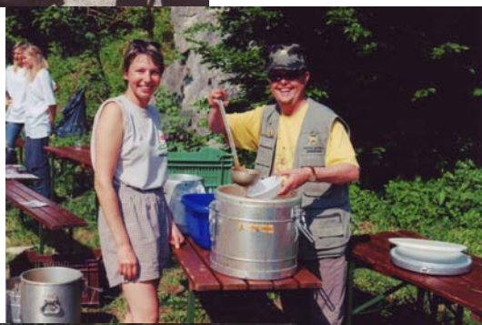
Pomagali so tudi fantje -leto 2003