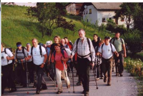
Pot se počasi vzpenja—leto 2006