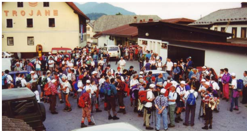
Zbor pohodnikov na Trojanah

TROJANE—PL.LIPOVEC—MOTNIK—SROBOTNO—REBER—SLOPI—NOVA POLJANA—BIBA PLANINA—PEČNA POLJANA—OSEKI—SKOJCE—RAVNE PRI ŠMARTNEM—POLJANA—SOVINJA PEČ—GOZD—SMREČJE V ČRNI—KRIVČEVO