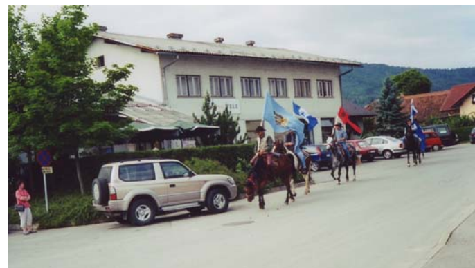
Najprej konjenica in za njo pohodniki

TROJANE—ŠIPK—ČEŠNJICE—VRH NAD KRAŠNJO—KORENO—BREZOVICA—TRNJAVA—GRADIŠČE—SP.KOSEZE—SOKLIČ—SV.TROJICA—ZG. JAVORŠČICA—CICELJ—ČEŠNJICE—MORAVČE