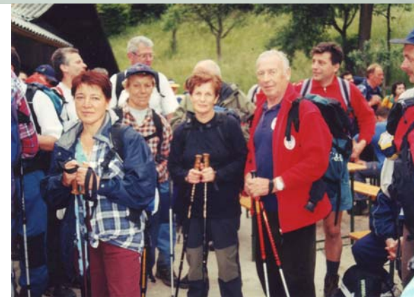
Zmogli smo...