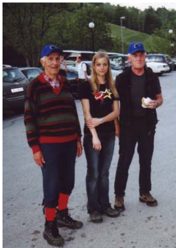
levo: Staneta je na pohod pospremila vnukinja – leto 2005

TROJANE—LIPOVEC—KOZJAK—ČEŠNJICE—TRAV.GRIČ—OSEKE— PEČNI GRIČ—JAVORŠEK—PREVALA—TOMANOVA PLANINA—ČRNI- VEC