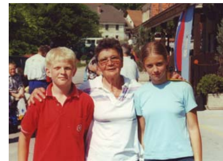
Leto 2001—srečno na cilju