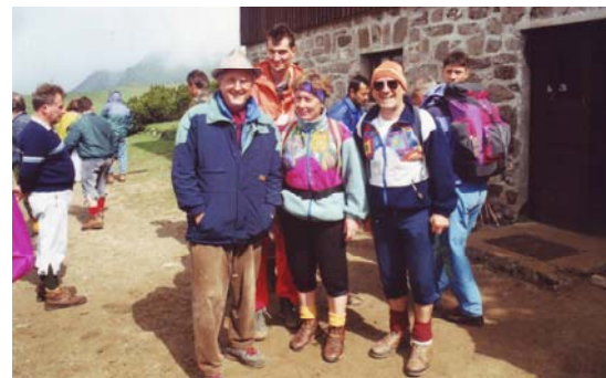
Velika planina—del nasmehane ekipe, ki je skrbela, da pohodniki niso bili lačni in žejni