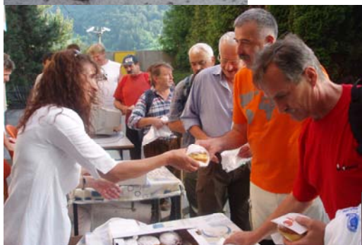
Krof za »popotnico« - leto 2007