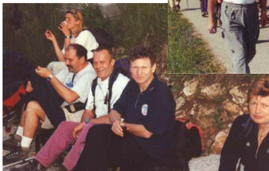
Počitek vodnikov...