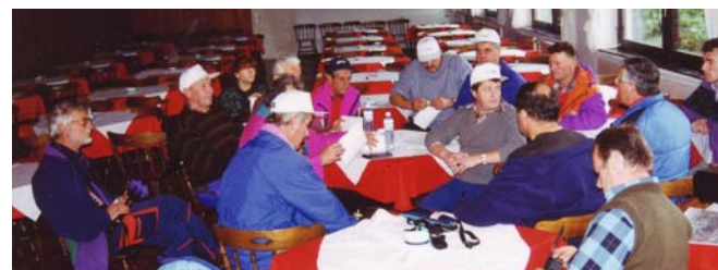
Še zadnji posvet vodnikov pred startom na Trojanah