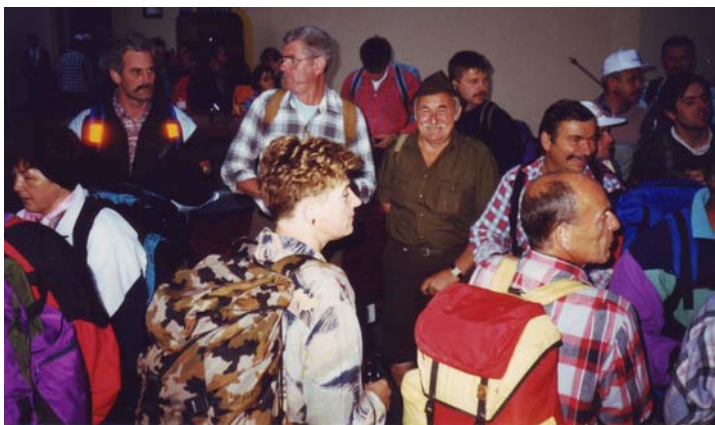
Med pohodniki je največ Kamničanov...

TROJANE—VELKA RAVEN—MALA RAVEN—STRMEC—MOTNIK—SROBOTNO—SLOPI—NOVA POLJANA—VEL.VRH (1454 m) - PLANINSKI DOM NA MENINI PLANINI—KURJI VRH—TRAVNIK—PLANINA RAVNE—TOMANOVA PLANINA—ČRNIVEC