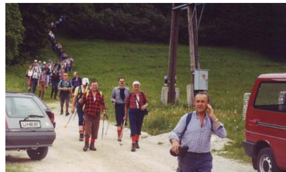
Kolona pohodnikov se približuje cilju...

TROJANE—LIMBARSKA GORA—KRAŠNJA—KORENO—LIPA—MALI RAKITOVEC—LAZE—KOSTAVŠKA PL.—ČRNIVEC