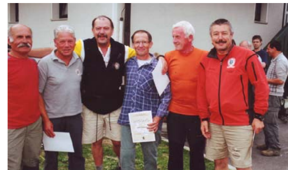
Leto 2009: diplome so podeljene ... nasvidenje na 20. pohodu