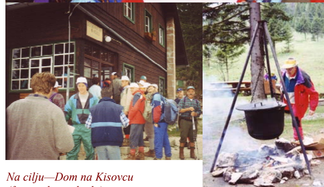
Na cilju—Dom na Kisovcu