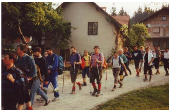
Kolona pohodnikov prihaja v zgodnje jutro v vas Potok

TROJANE—LIPOVEC—ŠPILJK—RATITOVEC—PECMAN—KOZJAK—ČEŠNJICE—OSEKI—SKOJCE—RAVNE—NOVIK—POTOK—URANJA PEČ—ZG. PALOVČE—STARI GRAD NAD KAMNIKOM—zdrruženo s Taborom ljubljanskih planincev