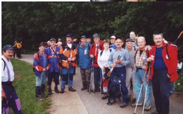
Še nasmeh fotografu in pohod se nadaljuje... - leto 2004