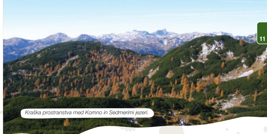
Kraška prostranstva med Komno in Sedmerimi jezeri.