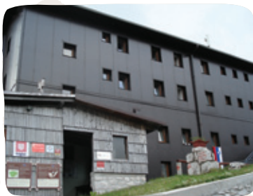
Dom na Komni – mogočen in udoben.