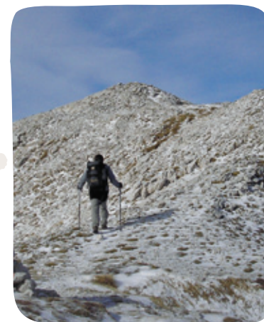
Gola pobočja Lanževice.