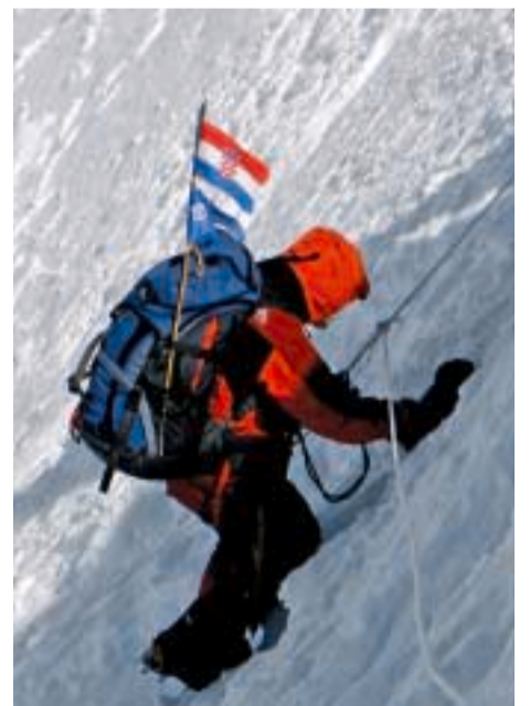
Ekspedicija Cho Oyu 2007. - Spust nakon uspjeha