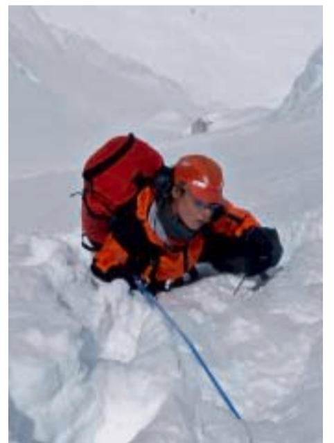
Ekspedicija Cho Oyu 2007. - Krajem rujna 2007. na Cho Oyuu je palo mnogo snijega