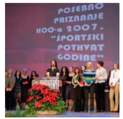
Ekspedicija Cho Oyu 2007. - Primanje priznanja HOO na Velikom danu hrvatskog sporta 27. 12. 2007. u KD »Vatroslav Lisinski« u Zagrebu