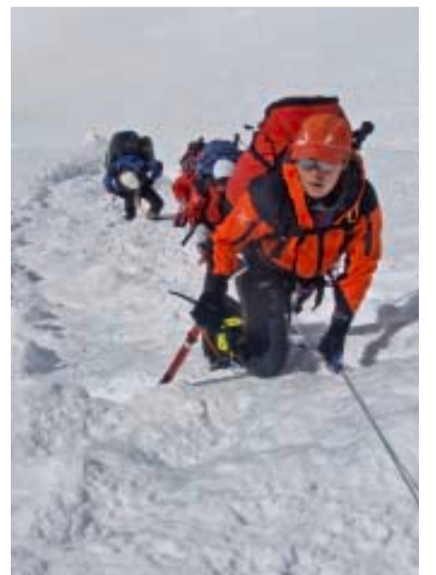
Ekspedicija Cho Oyu 2007. - Uspon prema Logoru 2