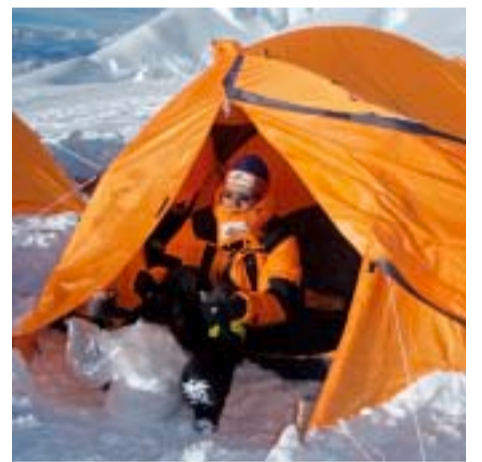
Ekspedicija Cho Oyu 2007. - Logor 2 na 7130 metara