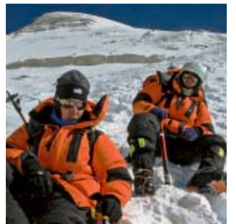
Ekspedicija Cho Oyu 2007. - Povratak s Cho Oyu