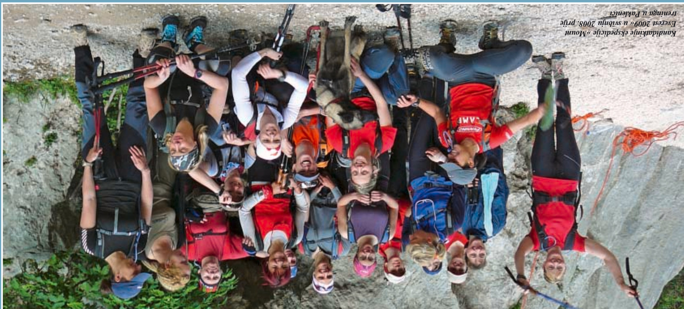
Kandidatkinje ekspedicije »Mount Everest 2009« u svibnju 2008. prije trenunga u Paklencu