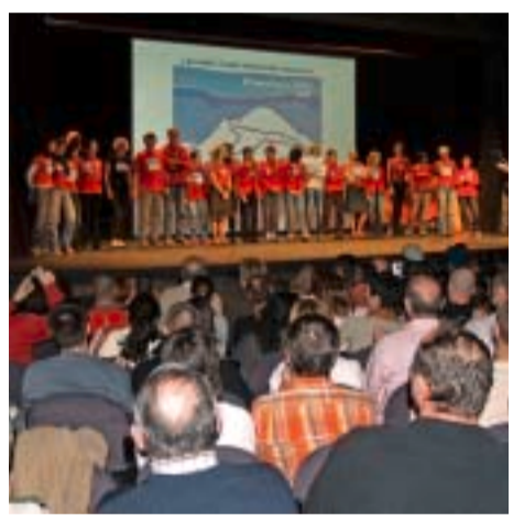
Ekspedicija Cho Oyu 2007. - Prvo predavanje o ekspediciji 12. 11. 2007. u Zagrebu