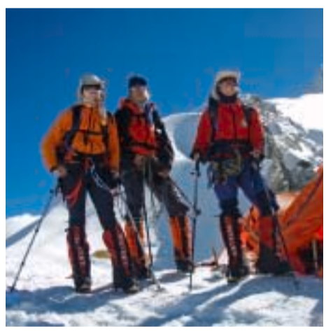
Ekspedicija Cho Oyu 2007. - iznad Logora 1