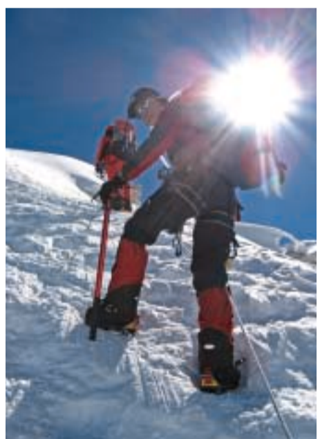
Ekspedicija Cho Oyu 2007. - Na strmom ledu na 6900 m