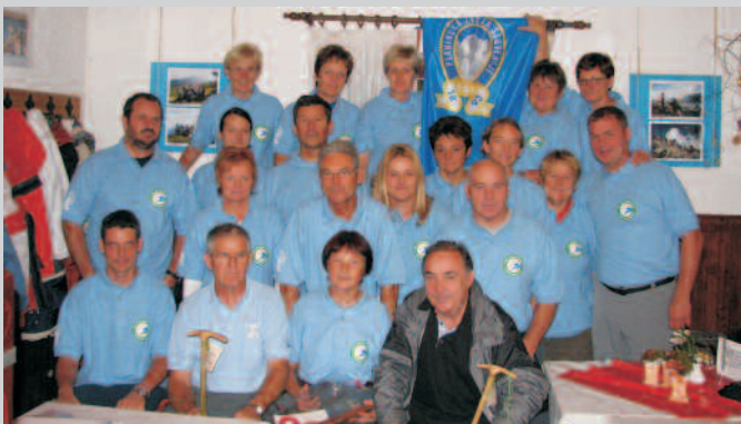
Varuhi gorske narave, podelitev diplom na Planini nad Vrhniko, oktober 2007

Varstvo gorske narave je med programi usposabljanj Planinske zveze Slovenije zastopano že od leta 1954 z izobraževanjem gorskih stražarjev. Ta se sedaj izvaja po posodobljenem programu.