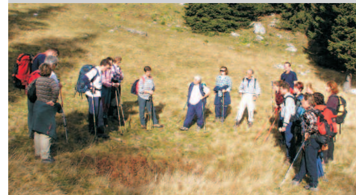
terensko delo na Veliki planini, oktober 2003

Program usposabljanja obsega 42 ur teorije, 18 ur praktičnega dela in 12 ur izpitnih obveznosti, skupaj 72 ur. Izpitne obveznosti obsegajo pisni izpit ter seminarsko nalogo.