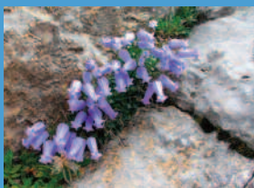
zoisova zvončica ( Campanula zoysii )