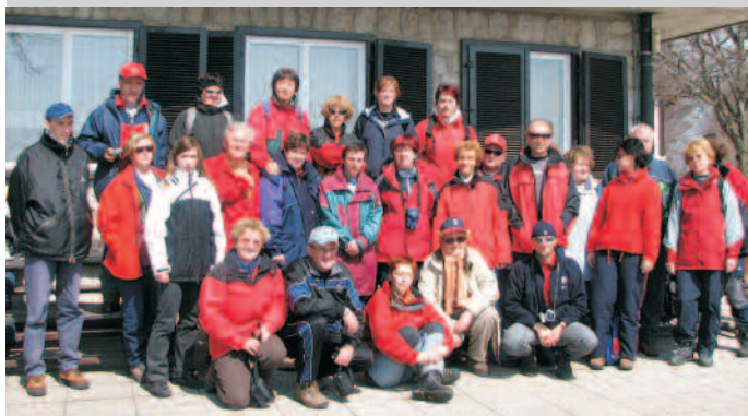
skupinska slika udeležencev na Lisci, april 2006

Udeleženci usposabljanja se seznanijo z ohranjanjem narave in naravnih vrednot, posebnimi varstvenimi območji (omrežje NATURA 2000) ter Alpsko konvencijo, temeljnim dokumentom za ohranitev Alp, katerega podpisnica je tudi Slovenija.