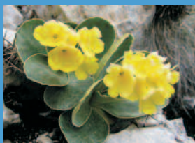
avrikelj, lepi jeglič ( Primula auricula )