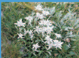
planika ( Leontopodium alpinum )