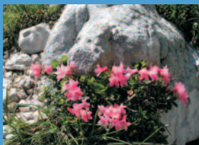
dlakavi sleč ( Rhododendron hirsutum )